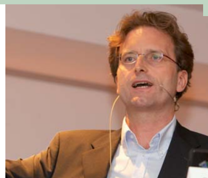
Univ.-Prof. Dr. Wolfgang Wimmer

« Comment les entreprises peuvent-elles se préparer à faire face à ces changements ? Nous ne sommes pas en train de parler de produits individuels, nous parlons d'excellence. Nous avons développé un modèle, qui se concentre sur quatre secteurs principaux : (1) une nouvelle approche, (2) une nouvelle action basée sur de nouvelles structures, (3) l'identifica-