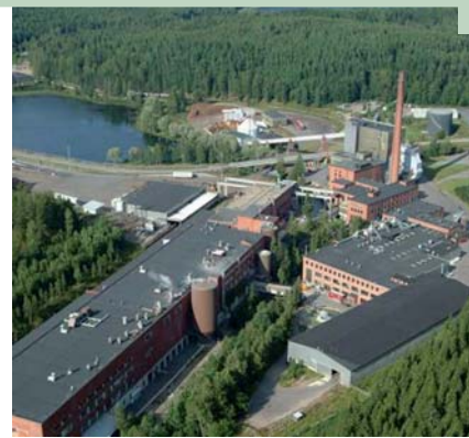
Usine de fabrication de carton plat oxyde de soufre et des émissions d'oxydes d'azote.

strées dans d'autres catégories d'impacts. Les résultats montrent un engagement fort et une amélioration continue. Les usines de fabrication de carton plat utilisent moins de bois et d'énergie et deviennent plus efficaces dans la gestion des ressources. Moins d'énergies fossiles consommées au niveau de la production et davantage de biomasse utilisée. Cela a pour conséquence une consommation moins forte des ressources fossiles et de l'eau et une diminution du dioxyde de carbone, du di-